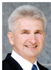
Prof. Dr. Andreas Pinkwart Minister für Wirtschaft, Innovation, Digitalisierung und Energie des Landes Nordrhein-Westfalen

Ich lade Sie herzlich ein, am Batterietag 2019 in Aachen teilzunehmen und wünsche Ihnen spannende Vorträge und viele neue Eindrücke und Impulse.